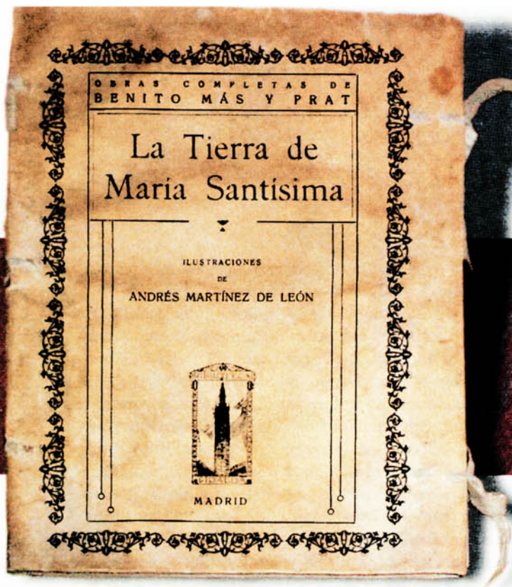
Portada de 'La Tierra de María Santísima'.