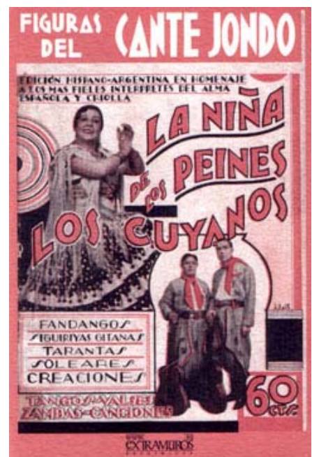
Portada de 'Figuras del cante jondo. La Niña de los Peines. Los Cuyanós'